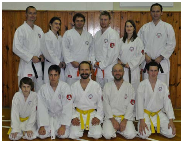
• Společná fotografie pardubických účastníků turnaje