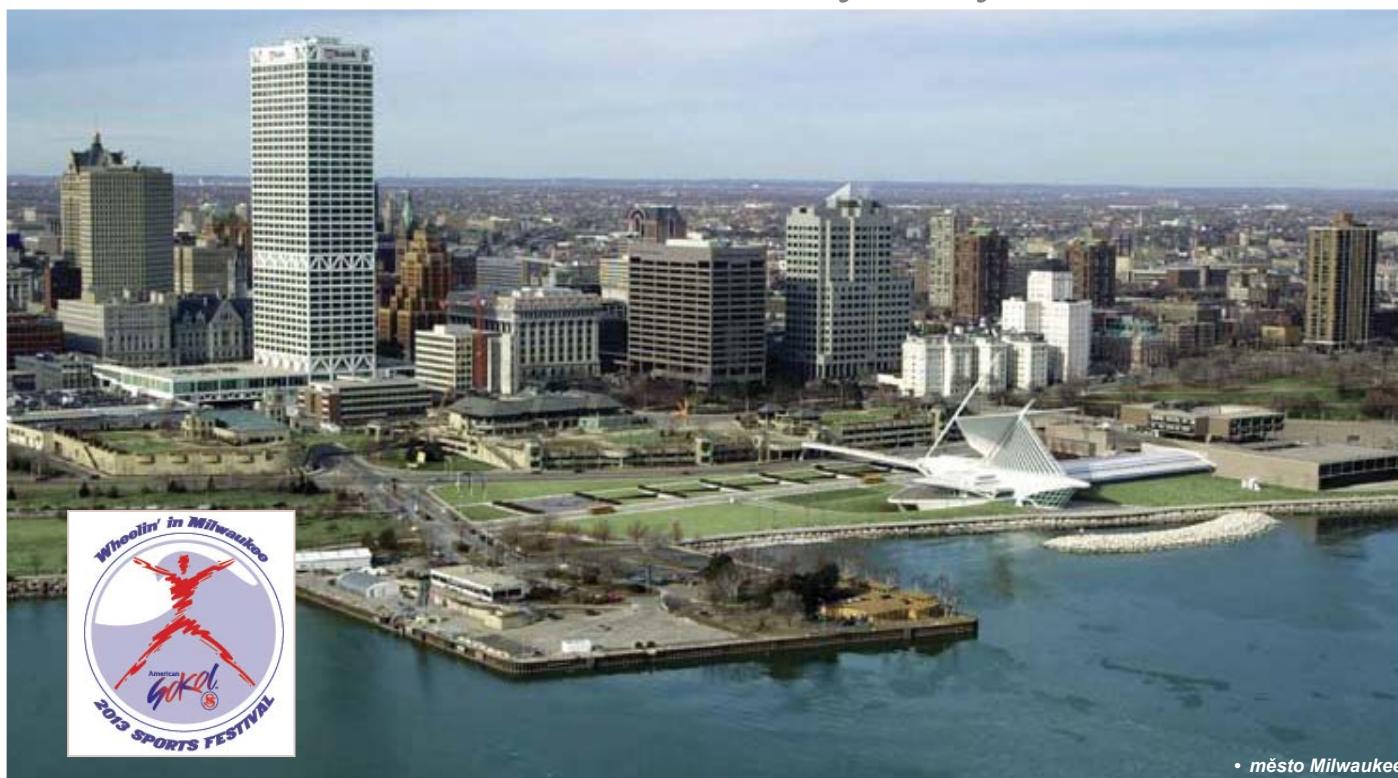
• město Milwaukee

Americká obec sokolská (AOS) připravuje již svůj XXIII. slet. Konat se bude ve městě Milwaukee ve státu Wisconsin ve dnech 25.–30. června 2013. Vzhledem k tomu, že se členové Sokola zajímají o možnou účast na tomto sletu a ve sletových skladbách, které se na něm budou cvičit, informoval se odbor všestrannosti spolu se zahraničním oddělením ČOS na možnou účast našich cvičenců v hromadných skladbách AOS.