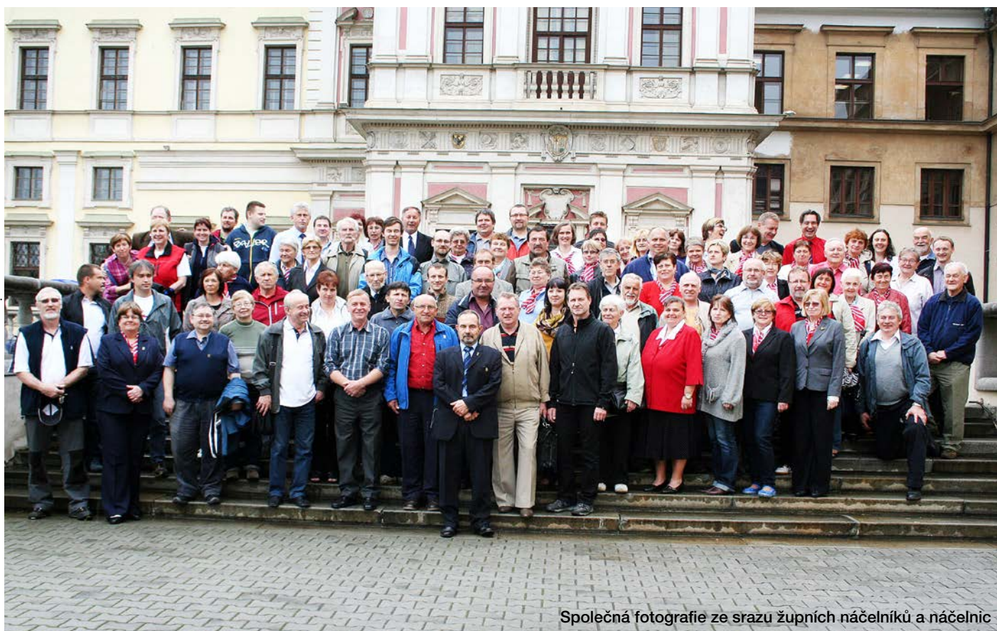
Společná fotografie ze srazu župních náčelníků a náčelnic