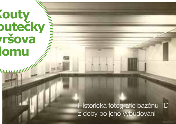
Historická fotografie bazénu TD z doby po jeho vybudování