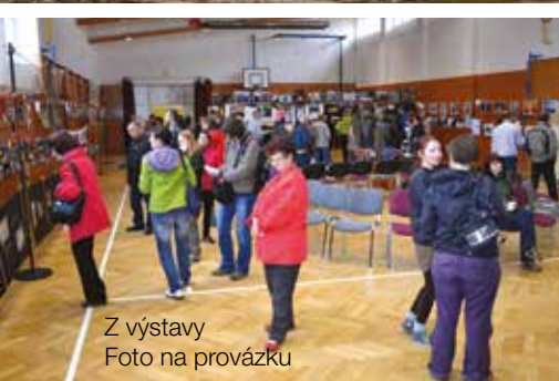
Z výstavy Foto na provázku