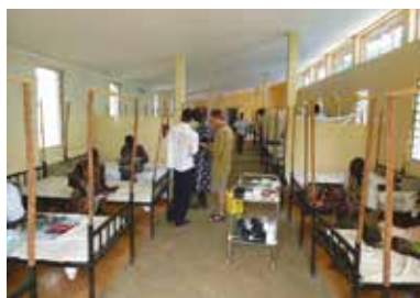
Vizita na dětském oddělení

Po příjezdu jsem si musel zvyknout jednak na velmi teplé počasí (přijel jsem ve vrcholícím období sucha) a též na to, že kromě nemocnice a místního trhu tu