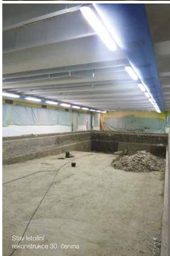
Stav letošní rekonstrukce 30. června