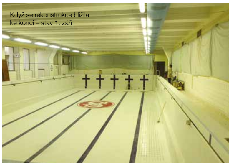
Když se rekonstrukce blížila ke konci – stav 1. září