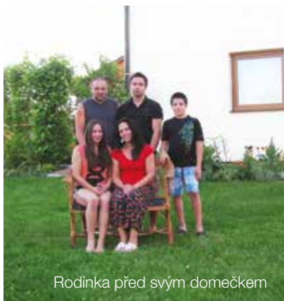
Rodinka před svým domečkem