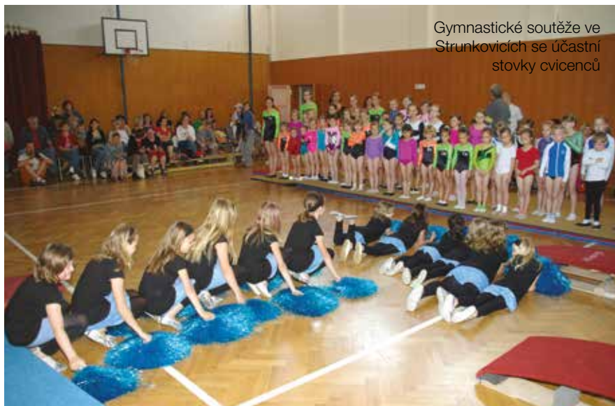
Gymnastické soutěže ve Strunkovicích se účastní stovky cvičenců