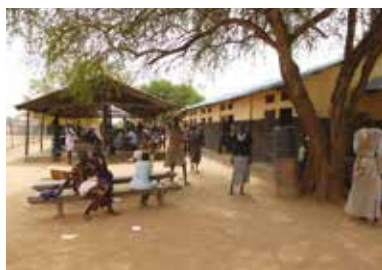
Čekárna před ambulancemi

není možnost kam jít, a tak je člověk připoután celou dobu na jedno místo. Pokud jde o práci, evropský lékař má dobrou příležitost poznat zde tropickou medicínu, kterou dosud znal jen z učebnic: poznal jsem, nakolik pestré projevy může mít malárie (dokonce jsem měl