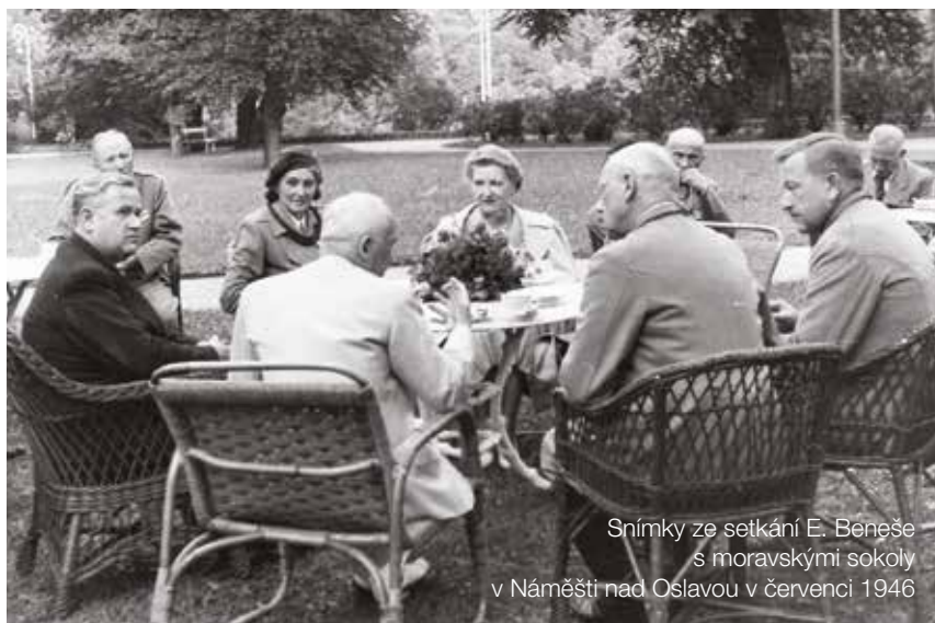
Snímky ze setkání E. Beneše s moravskými sokoly v Náměšti nad Oslavou v červenci 1946

tele Krejčího a prezidenta Beneše, byly pohledy do nedávné minulosti od Mnichovské zrady v roce 1938, přes okupaci se všemi útrapami a oběťmi i se zhodnocením zahraničního odboje až po účast sokolů na něm. Zde měl v debatě co říci starosta Sokolské župy Středomoravské-Kratochvilovy Rudolf Lukašík, který v exilu strávil téměř šest let a stýkal se v Anglii i s prezidentem Benešem. Prezident vzpomenu i odsunu našich Němců v roce 1946, když toto téma připomínal i při jiných příležitostech a zřejmě je cítil jako vážný problém, který se s ohledem na velké lidské oběti na české straně nedal jinak řešit. Prezidentova role během únorového puče 1948, dopředu připraveného a řízeného komunisty, bývá opakovaně předmětem hodnocení, ale postupně se dochází k tomu, že na úplném předání moci komunistům se za tehdejší politické konstelace v podstatě nic už změnit nedalo. Dne 9. května 1948 byl pod č. 150/1948 schválen Ústavní zákon Ústava Československé republiky. Měl 177 paragrafů a v tom posledním bylo 11 podpisů. Chyběl podpis prezidenta Edvarda Beneše. Ten se nakonec rozhodl komunistům vzepřít, když odmítl novou československou ústavu (tzv. Ústavu