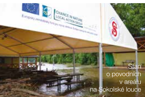
Stan o povodních v areálu na Sokolské louce

Není jednoduché jít za něčím, ale vyplatí se to. Když se pro něco rozhodnete, když si najdete svůj cíl, máte z poloviny vyhráno. Ta druhá polovina, kterou k cíli musíte urazit, je ale ještě „sakra“ těžká, ale stojí za to ji ujit. ☺