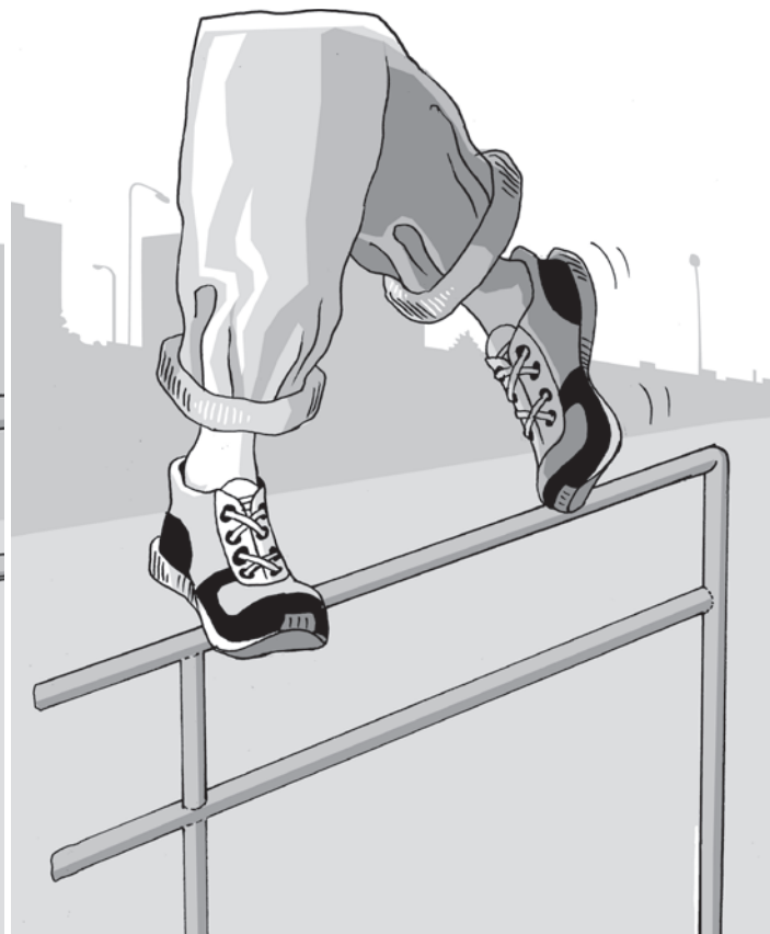
obrázek 4 – Technika došlapu s vytočením chodidel