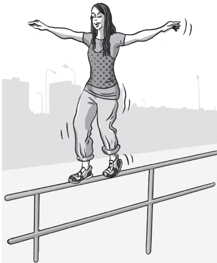
obrázek 1 – Výchozí poloha při chůzi v bočním postavení

ných kompenzačních pohybech trupu. Na rozdíl od balančních pomůcek využívaných ve fitness a fyzioterapii (jako asi nejpopulárnější příklad jmenujme bosu) využívá parkour většinou nepohyblivé prvky prostředí (nářadí) jako zábradlí či zídky. Prvkem zvyšujícím nároky na rovnováhu je zde malá plocha opory chodidla.