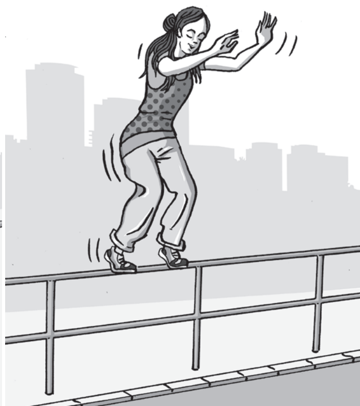
obrázek 2 – Výchozí poloha při chůzi v čelném postavení