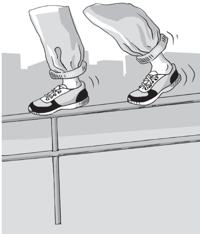
obrázek 3 – Optimální technika došlapu při chůzi vpřed