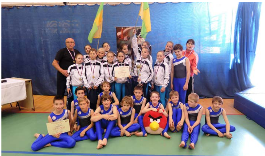
Na fotografiích mistrovské týmy Sokola Příbram

Protože byli všichni pečlivě připraveni po náročných trénincích, mohl v sobotu zabodovat omlazený tým starších děvčat v kategorii Junior IV. Také chlapci a děvčata z kategorie Mix Senior zvítězili ve své kategorii. V neděli pak tým děvčat v kategorii Junior II v téměř novém složení s mladšími posilami zacvičil, jak nejlépe mohl a znovu byl příbramský zlatý hattrick na světě. Vítězství těch mladších bylo o to cennější, že v kategorii Junior II závodilo 13 družstev a příbramské holky a kluci ve věku 9–12 let soupeřili často i s 16letými dívkami. Děti ale znovu ukázaly, že díky