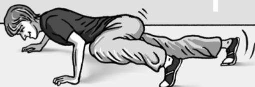
obrázek 3 – Spiderman, lezení v kliku