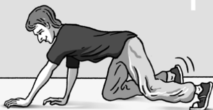
obrázek 3 – Spiderman, lezení v kliku