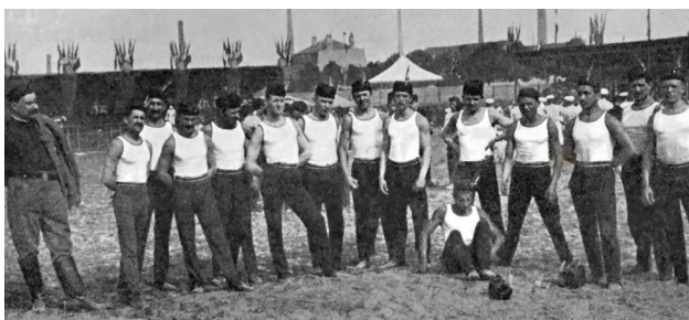
Pařížští sokolové v Remeši v červenci 1914. Právě tyto muži se stali základem první jednotky československých legií ve Francii