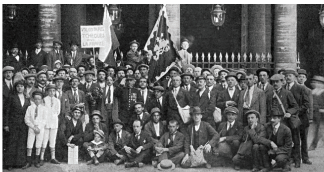
Čeští dobrovolníci s praporem pařížského Sokola před vstupem do Cizinecké legie