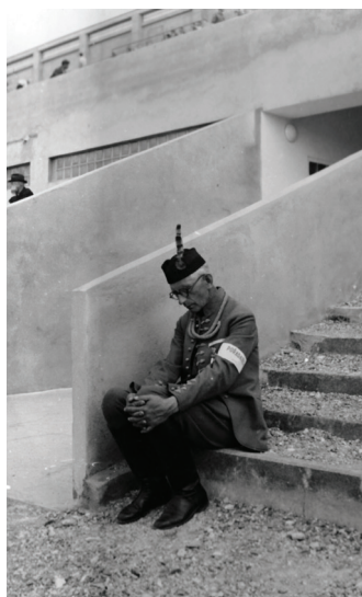
XI. všesokolský slet byl v roce 1948 labutí písni sokolské organizace