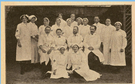
Lékaři a ošetřovatelky lazaretu v tělocvičně Sokola Žižkov v roce 1914

(K. Bíma, Otevření prvního lazaretu ČOS v žižkovské sokolovně dne 1. září 1914, Věstník sokolský – List České obce sokolské se zdravotní hlídkou, roč. XVIII., č. 18 ze 17. 9. 1914, kráceno.)