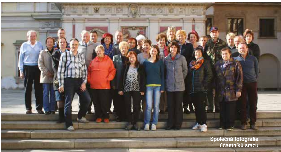
Společná fotografie účastníků srazu

nejen jako s vyrážkou poté, co sníme nějakou potravinu, ale i jako s rýmou a pálením očí po setkání s pyly některých rostlin. Jednou z forem alergie je i atopická dermatitida (ekzém) a průduškové astma. V zásadě se lze alergickým projevům vyhnout vyloučením např. některých potravin z jídelníčku. V případě pylové alergie již situace tak jednoduchá není a musíme většinou používat léky z kategorie antihistaminik. Samostatnou kapitolou by potom byla léčba průduškového astmatu, kdy používáme v dnešní době zejména inhalační léky, které způsobí roztažení astmatem zúžených průdušek a tlumí jejich trvalý zánět. Nejnebezpečnějším projevem alergie je anafylaktický šok, který může vzniknout nejen jako reakce na poštípání hmyzem, ale i třeba po pozření oříšků osobami, které jsou na oříšky alergické. V takových případech dochází často k rychlému otoku obličeje a dýchacích cest. Osoby, které trpí takovou formou alergie, jsou vybaveny