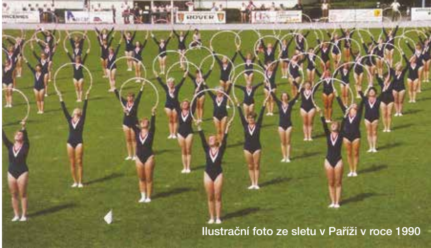
Ilustrační foto ze sletu v Paříži v roce 1990

Lednové shromáždění už bylo skutečně organizačně připraveno vynikajícím způsobem. Bylo svoláno do levého křídla bývalého veletržního paláce v tehdejším holešovickém Parku kultury a oddechu. I tento prostor byl zcela zaplněn. Všechny zde shromážděné bývalé sokoly zde zdravili zástupci zahraničních sokolů, ale dokonce i zástupci mnoha tělovýchovných organizací, fungujících za minulého režimu. Těžko říci, co je k tomu vedlo, zda také vzpomínky či očekávání, co s nimi v budoucnosti bude. Organizátoři měli připraveny již i přihlášky do obnovovaného spolku, které nedlouho na to posloužily v mnoha obnovovaných sokolských jednotách k vytváření prvních činovníckých kolektivů. Svým charakterem, tj. shromážděním všech sokolů, kteří se zde svými