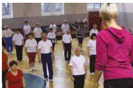
Z nácviku na 15. světovou gymnestrádu – Hradec Králové