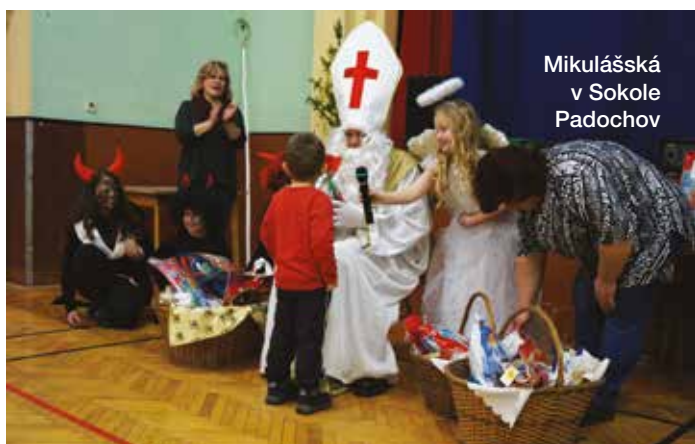
Mikulášská v Sokole Padochov