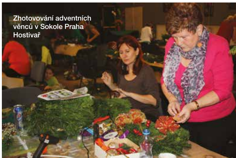
Zhotovování adventních věnců v Sokole Praha Hostivař