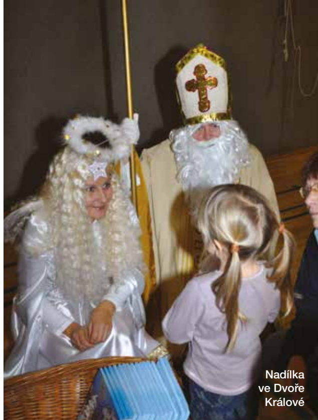
Nadílka ve Dvoře Králové