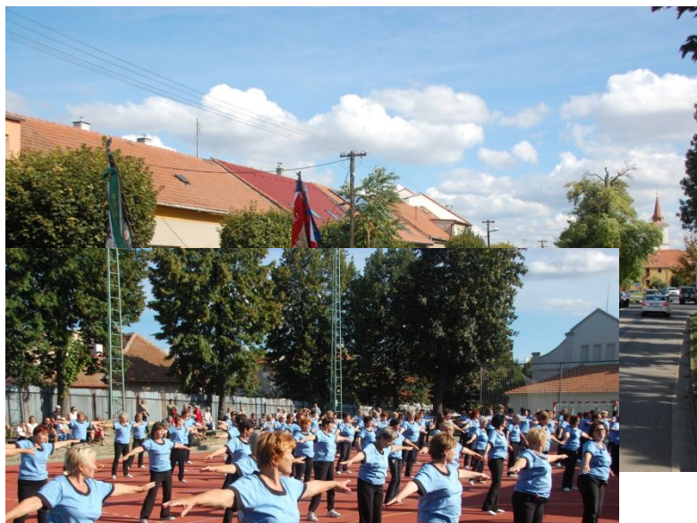
Veřejné cvičení Újezd u Brna