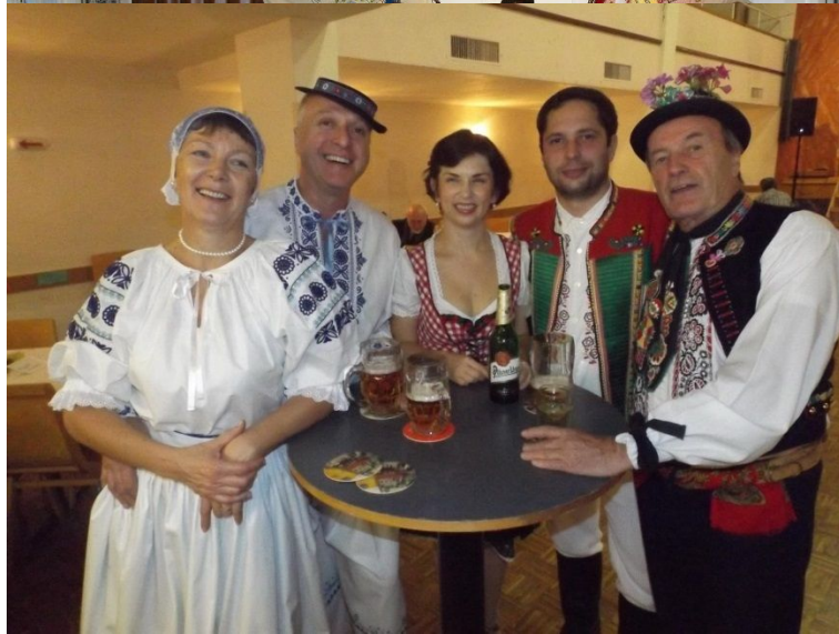
oravské hody ve Vídni