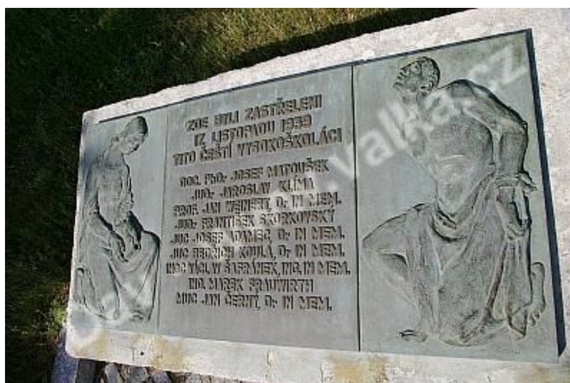
Památník v prostoru dělostřeleckých kasáren

„...My, kteří dnes s ostatní mládeží tvoříme jednotu, ucelenou frontu proti všem druhům fašismu a nesvobody, bez rozdílů politických, národnostních a náboženských, kteří se zbrání v ruce bojujeme na všech bojištích za svobodu svého lidu, skláníme se před obětmi barbarského násilí, posílení jejich příkladem vybojovat budoucím generacím lepší a spravedlnější budoucnost. 17. listopad bude pro nás navždy dnem, kdy studentstvo celého světa uctí na svých školách nejen památku popravených československých kolegů, ale i dnem, kdy si znovu a znovu připomeneme ideály, za které tito hrdinové padli...“