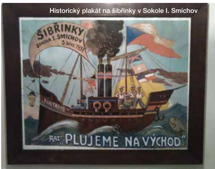
Historický plakát na šibřinky v Sokole I. Smíchov