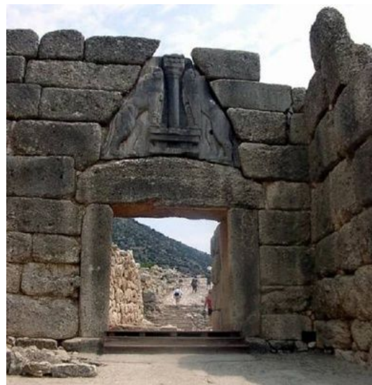
„Lví brána“ v Mykénách

Schlieman věnoval vykopávkám, jejich určení a umístění artefaktů v museích (především v Berlíně – v tehdejší Turecku hrozilo akutní nebezpečí, že budou rozkradeny nebo zničeny) veškerý svůj čas a svůj majetek. Přes všechny omyly má nehynoucí zásluhu na potvrzení homérských textů a je považován za jednoho ze zakladatelů moderní archeologie.