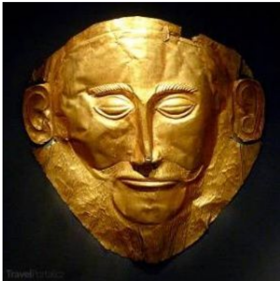
Maska krále Agamemnona

masku, kterou si dnes můžete prohlédnout v archeologickém museu v Athénách, označil jako odlitek tváře krále Agamemnona, je však daleko starší.