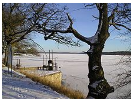
Rožmberk v zimě