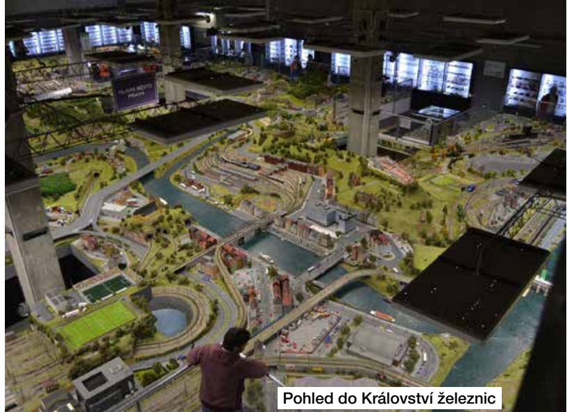
Pohled do Království železnic

Ještě jsme neplánovaně stihli výstavu Obří oceánů v obchodním centru Nový Smíchov, kde jsme se dívali na makety zvířat žijících v moři, jako je běluha, kosatka, krakatice, plejtvák, manta a zajisté nesměl chybět i žralok se svými čelistmi a zuby.