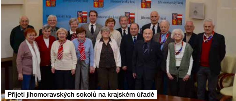
Přijetí jihomoravských sokolů na krajském úřadě