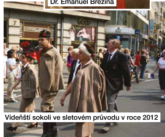
Vídeňští sokoli ve sletovém průvodu v roce 2012

V roce 1948 došlo v Praze k násilné změně politických poměrů, která znamenala konec Sokola v Československu. Župa Rakouská se stala přes noc hlavním nositelem myšlenky svobodného sokolstva v Evropě. Postupně se vytvářely základní prvky pro založení Ústředí československého sokolstva v zahraničí, které pak bylo skutečně v roce 1950 založeno v USA. Sokolská župa Rakouská se stala jeho členem v roce 1952. Vedle pravidelné činnosti se vídeňští sokoli zúčastnili sedmi „Sokolských sletů svobodného sokolstva v zahraničí“ a jiných podniků.