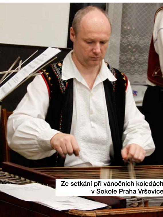
Ze setkání při vánočních koledách v Sokole Praha Vršovice