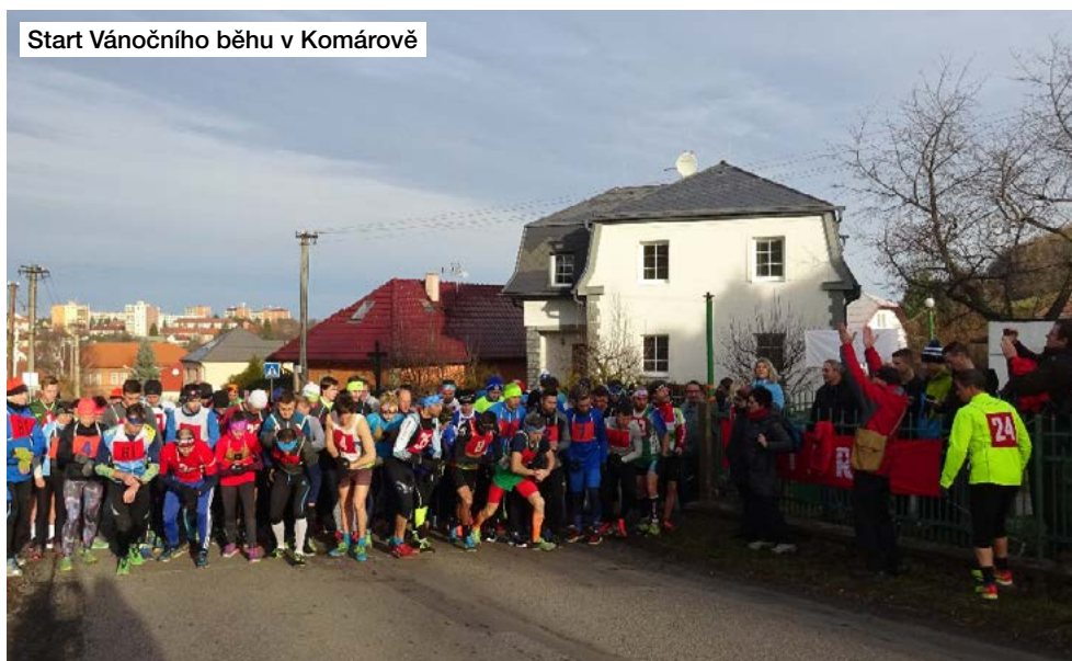
Start Vánočního běhu v Komárově