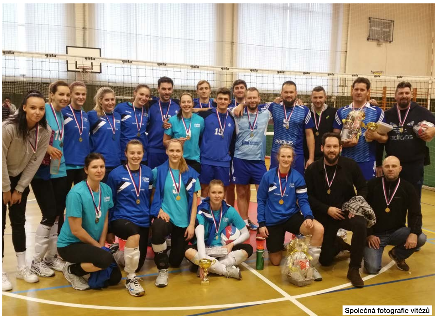
Společná fotografie vítězů