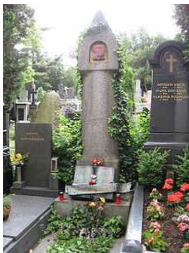
Hrob Karla Čapka a Olgy Scheinpflugové na Vyšehradském hřbitově v Praze