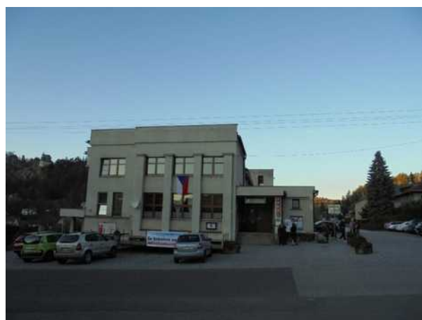
Sokolovna na Malé Skále