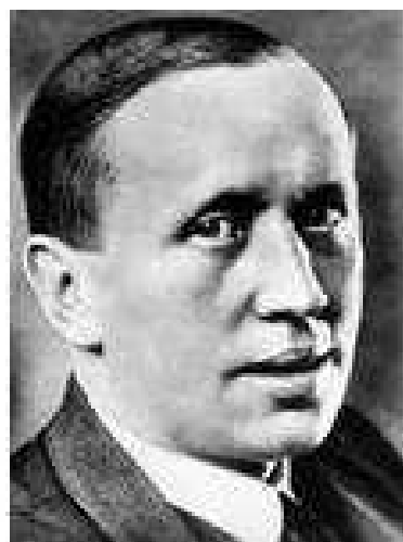
Karel Čapek – narozen 9. ledna 1890 - zemřel 25. prosince 1938