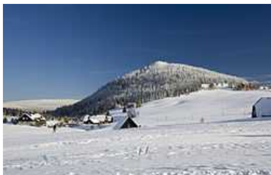
Bukovec a osada Jizerka

Na těchto stránkách už vůbec nezbyvá místo na vyprávění i Jizerské magistrále, zbytečných bývalých sklářských hutí, o pomníčcích dávných lesáků, pytláků a pašeráků (po vydání Nevrlého knihy „Jizerské ticho“ jsme je všichni hledali a pátrali po nich) a obecně známých akcí, jakou jsou třeba „Jizerské tisícovky“, různé dálkové jízdy a především „Jizerská padesátka memoriál expedice Peru“! To je nutno zkusit na vlastní kůži!