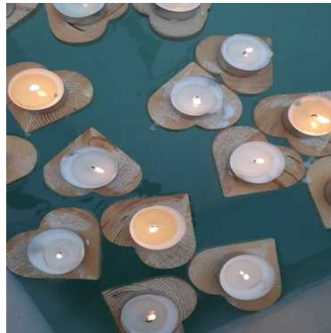
Krásná hora nad Vltavou