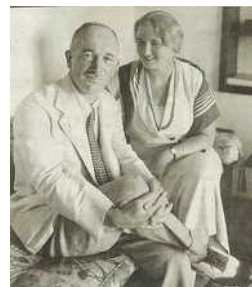
Hana Benešová - manželka Edvarda Beneše,...