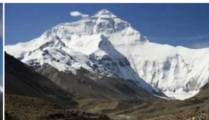
Mont Everest – Himalaj